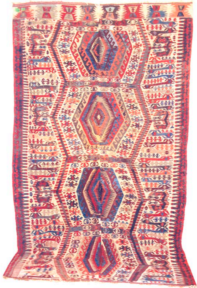
Region Kula-Selendi, im 19. Jhd. von Aydınli gewebt, Hakenbordüre einseitig.