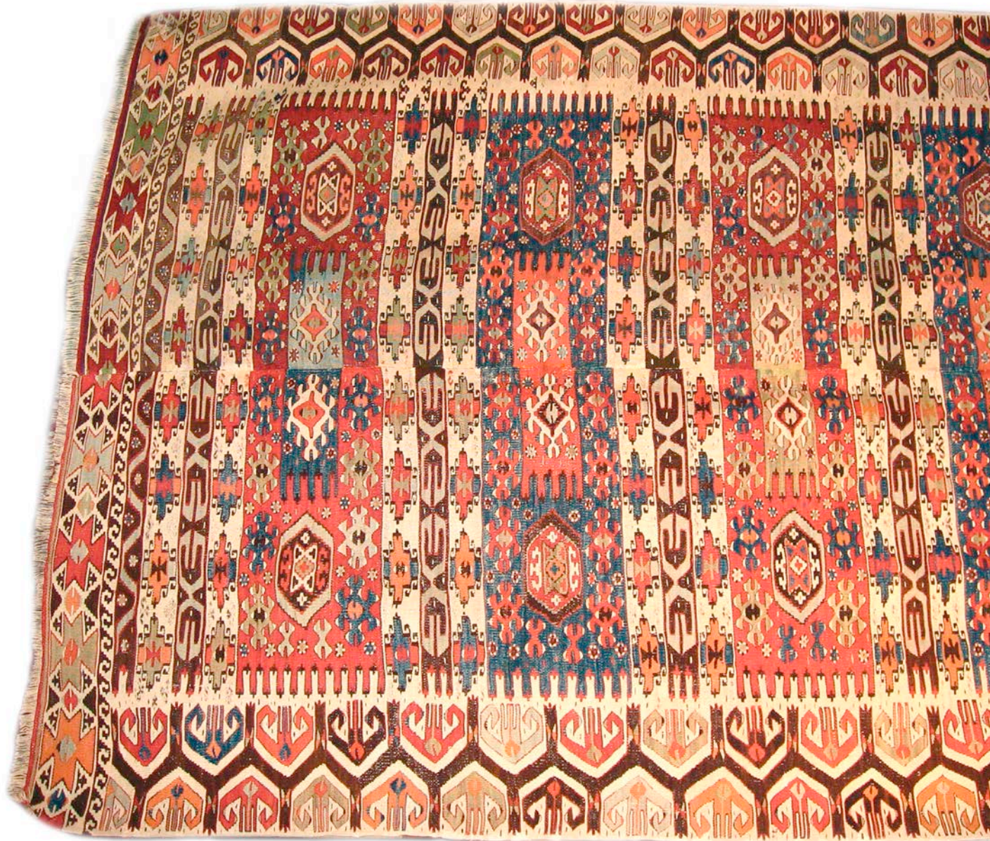
Menderes Mündungsgebiet, im 19. Jhd. von Afsharen gewebt, Sternbordüre, Blüten im Innenfeld.

Delta region of the Menderes River, woven by Afshars in the 19th century, star border, flowers in the inner field.