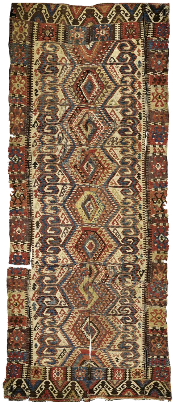
Brändls schönster Aydın-Kelim aus dem Raum östlich von Kula, Westanatolien, Ende 18. Jhd. gewebt, 485 x 202 cm (Signet Galerie Kelim), seltene Elibelinde Endbordüren beidseitig. Brändl's most beautiful Aydın kelim from the area east of Kula, Western Anatolia, woven in the late 18th century, 485 x 202 cm (approx. 15' 11" x 6' 8") (signet for Galerie Kelim), rare elibelinde end borders on both sides.

Das Gebiet des Aydınli-Kelims in Westanatolien reicht von Muğla bis Kütahya und von Manisa bis Burdur. Aydın selbst war schon lange vor dem Turkmenensturm im 11. Jh. n. Chr. ein Zentrum für Handel und Agrikultur. Durch das nahe Mittelmeer und die Lage am wasserreichen Fluss