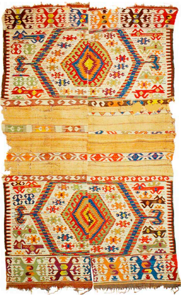
Kelim (Kameldeckenmodell), West-Anatolien, Region Kula-Kütahya, um 1800 von Aydınli-Develi-Yörük gewebt, 316 x 194 cm mit beidseitiger Hakenbordüre.

Kelim (camel cover model), Western Anatolia, Kula-Kütahya region, woven around 1800 by Aydınli-Develi-Yörük, 316 x 194 cm (approx. 10' 4" x 6' 4") with a hook border on both sides.