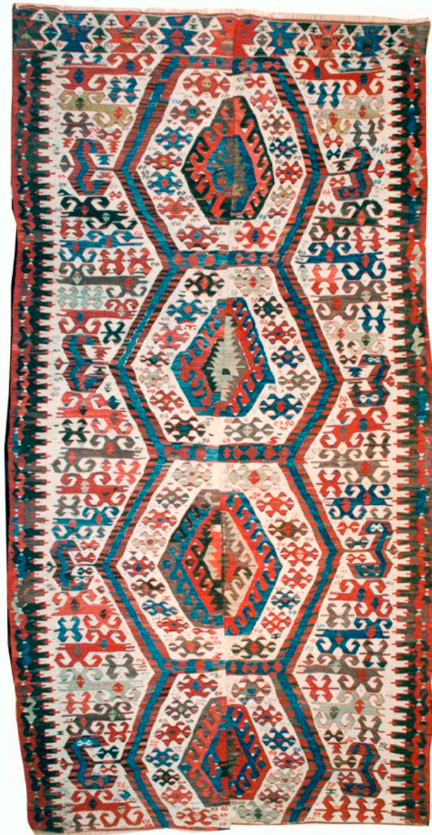
Kula Selendi, 19. Jhd., von Aydınli gewebt, Sternbordüre einseitig.