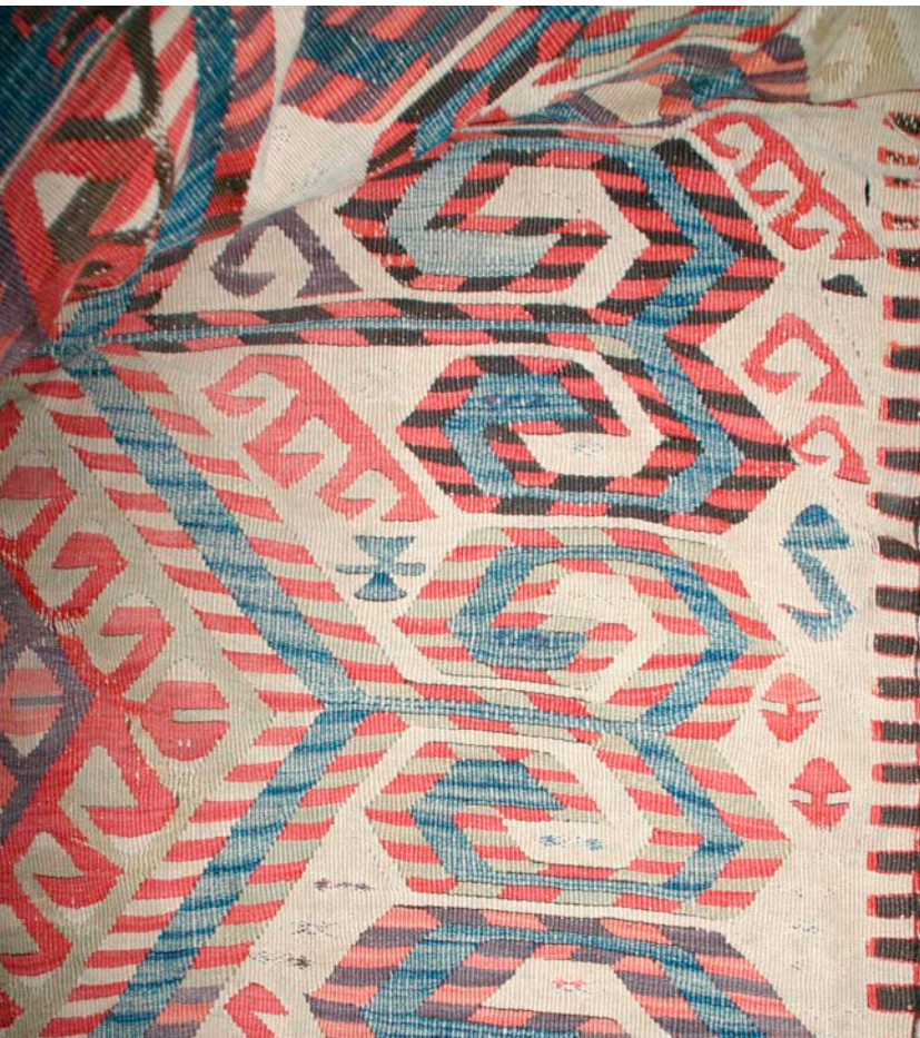
Östlich von Kula, Detail des „Signetkelims“ rechts, Ende 18. Jhd., veränderte Hakenformen im Innenfeld.

East of Kula, detail of the “signet kelim” on the right, late 18th century, modified hook forms in the inner field.