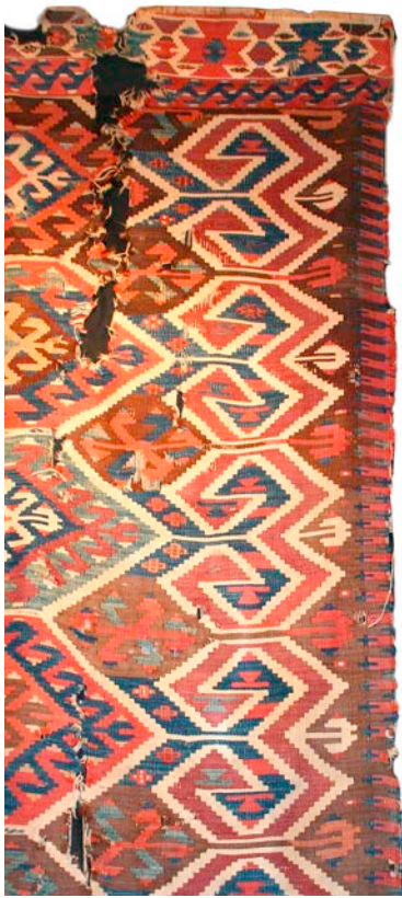
Karakoçarli, nördlich des Menderesgebietes, 19. Jhd., Sternbordüre beidseitig.

Karakoçarli, north of the Menderes River Valley, 19th century, star border on both sides.