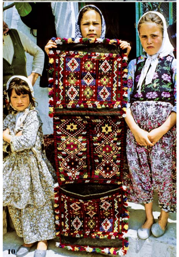
9 | Satteltasche am Webstuhl in einem Dorf der Kılaz, Değirmenbaşı, Korucu, 1981.