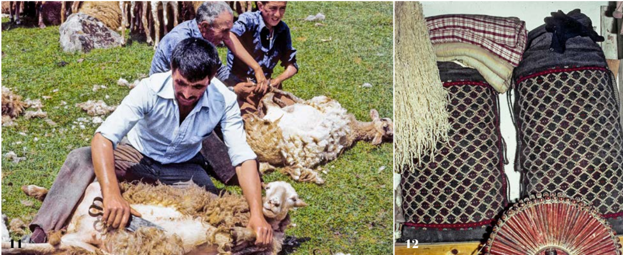
11 | Scheren der Kıvrıkcık-Schafe (westanatolische Schafrasse) bei den Yüncü, Kocaören, Balıkesir-Gebiet, 1982.