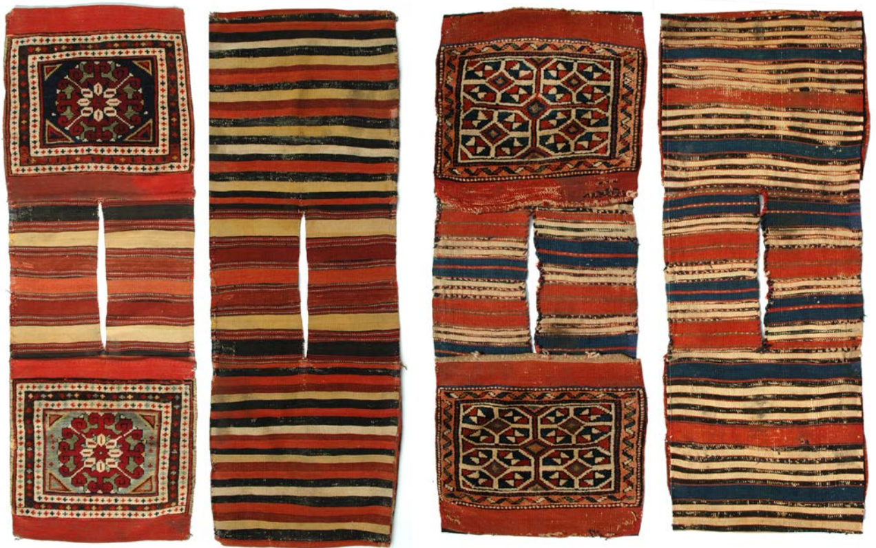
6 | Kılaz Heybe, geknüpft Satteltasche (heybe).