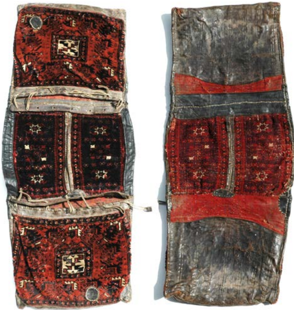
2 | Sındırgı-Yağcıbedir Heybe, geknüpftes Pferdesatteltasche (at heybe) mit Lederbesatz. Leihgabe Galerie Kelim Würzburg 2 | Sındırgı-Yağcıbedir heybe, knotted horse saddle bag (at heybe) with leather reinforcement. item on loan from Gallery Kelim, Würzburg