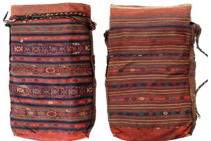
5 | Karakeçili Çuval, Flachgewebe mit reziproker Broschierung.

Later on during the rule of Mehmet II (1432-1481), the conqueror of Constantinople, the western nomadic tribes of Asia Minor and the Balkans were called Yürüks or Yörüks. Derived from Turkish (yürümek means to wan-