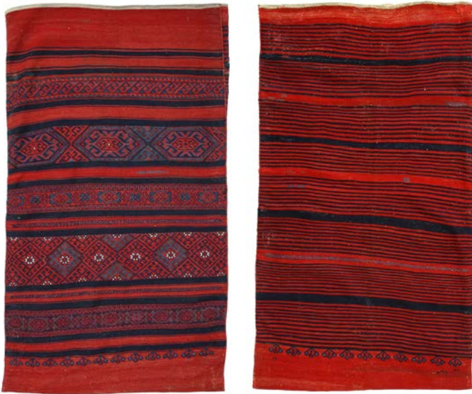
4 | Yüncü Çuval, Flachgewebe mit reziproker Broschierung.

4 | Yüncü çuval, flat-weave with reciprocal embroidery.