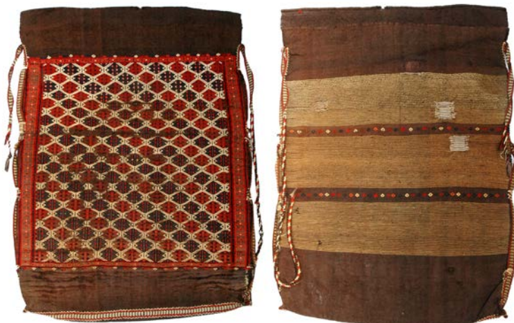
1 | Broschierter Sındırgı-Yağcıbedir Çulsack (çul çuval), Vorder- und Rückseite aus Ziegenhaar. Leihgabe Galerie Kelim Würzburg

Rashid al-Din (1247-1318, Persian vizier and historian from Tabriz) reports of two Oghuz main tribes in his his-