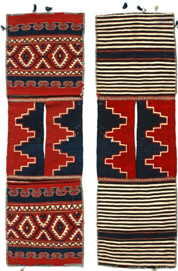
8 | Heybe aus dem Großraum Bergama, gewebte Satteltasche (heybe). Kılaz?

According to Doris Pinkwart's research, the Karakeçili are the largest Yürük tribe in northwest Anatolia. Their settlement areas extend from the western Anatolian high plateau near Eskişehir to the greater Balıkesir-Bergama region. They were already recorded in Ottoman tax lists from the 16th century. As followers of the sultan, they enjoyed many special rights in the Ottoman Empire (such as exemptions from sheep tax and military service). To this day, the Karakeçili are still highly regarded among other Yürük tribes. There are two ways to interpret their tribal name: "the people with the black goats" or "the people with the black felts". The old decorative sacks and saddle bags of the Karakeçili are characterised by their saturated and lightfast natural colours. As textiles that were used every day, they were always exposed to a lot of wear and tear. In a study of more than 500 comparable pieces, it was found that the key to determining the tribal affiliation comes primarily from analysing the backs (see picture 5). The fronts are worked in an elaborate reciprocal embroidery technique (sumak), while the backs show colourful horizontal strips in various widths with decorative elements (cicim).