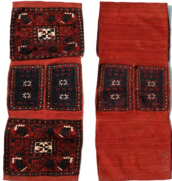
3 | Sındırgı-Yağcıbedir Heybe, geknüpftes Pferdesatteltasche (at heybe) ohne Lederbesatz. 3 | Sındırgı-Yağcıbedir heybe, knotted horse saddle bag (at heybe) without leather reinforcement.

schichte von zwei Oghusen-Hauptstämmen. Genauere Angaben zu diesen Volksgruppen lassen sich bereits bei Mahmud al-Kashgari finden (1008-1105, türkischer Gelehrter aus Barskoon am Südufer des Issyk Kul in Kirgisistan, Verfasser eines türkisch-arabischen Wörterbuchs). Das Geschichtswerk „Shajara-i terakime“ des Abul Ghazi Bahadır (1603-1663, Khan von Chiwa) zeichnet ein genaues Bild vom Stammbaum der Oghusen. Nach diesen schriftlichen Überlieferungen gibt es zwei Hauptstämme der Oghusen: die Bozok („Volk der Grauen Pfeile“) mit den 12 Unterstämmen der Afşar, Alkaevli, Bayat, Begdili, Döğer, Dondorga, Karaevli, Kayı, Karkın, Kızık, Yazır, und Yaparlı und den Üçok („Volk der Drei Pfeile“) mit den 12 Unterstämmen der Bayındır, Beçenek, Büğdüz, Çavuldur, Çepni, Eymür, İğdir, Kınık, Salur, Ulayundluğ, Yıva und Yüreğir.